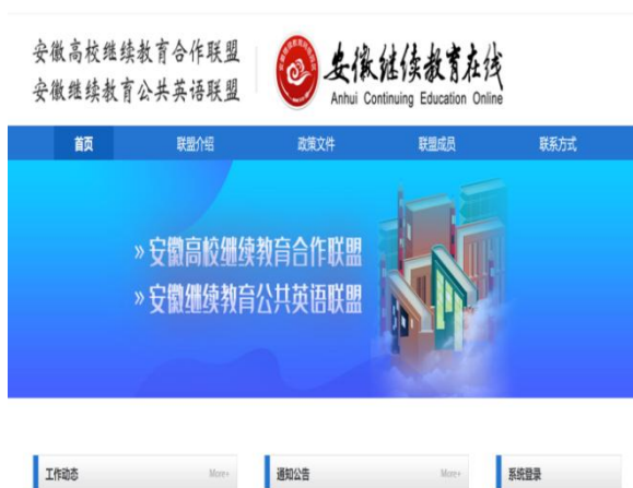
图 2：联盟发文列表及联盟主页