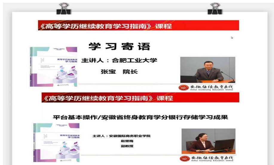
图 4：“高等学历继续教育学习指南”课程

联盟 28 所院校联合共同建设“高等学历继续教育学习指南”课程，含 26 讲视频资源及对应文本资源和题库，配套教材也已正式出版。“高等学历继续教育学习指南”课程建设在国内尚属首次，共分为八个模块，涵盖了高等学历继续教育相关基本政策和知识、继续教育教学与管理平台登录与信息查询、网络课程资源学习与考核等，进一步促进了安徽高等学历继续教育健康有序发展，巩固教育教学模式改革成果，提升了高等学历继续教育人才培养质量。