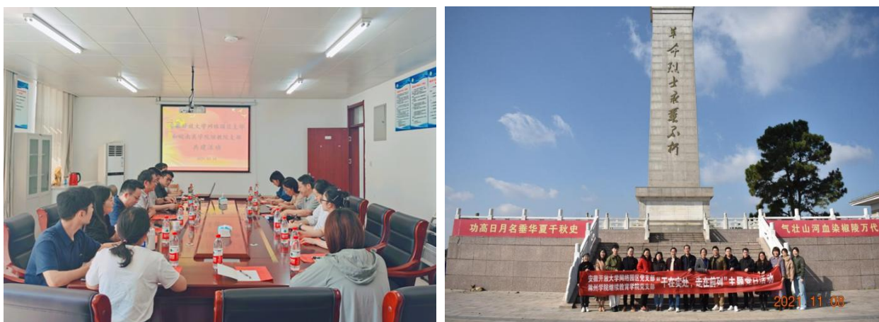
图 1：联盟成员单位支部共建交流活动

联盟始终坚持以习近平新时代中国特色社会主义思想为指导，全面落实国家、省关于继续教育改革发展的各项政策文件精神。联盟秘书处（园区管理中心）党支部于7月19日，11月8日分别与联盟成员单位皖南医学院继续教育学院党支部和滁州学院继续教育学院党支部开展支部共建交流活动，围绕园区建设、学历继续教育发展、学分银行建设等问题开展座谈交流。