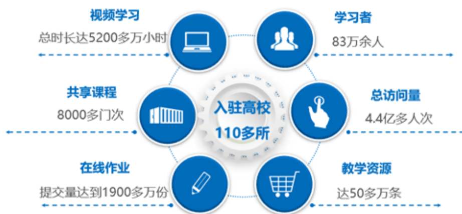
图 1 园区平台数据统计图

目前，园区入驻高校及教育机构 110 多所，累计注册学习者 83 万余人，资源总量 50 万多条，其中视频资源 36 万多讲，上线课程 13000 多门，学习者提交在线作业 1900 多万份，视频学习时长 5200 多万小时，总访问量超过 4.4 亿。高校间实现 8000 多门课程学习成果及评价的互认，涉及近 100 万人次。如图 1 所示。